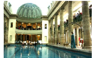
LANGE NACHT DER OPERN UND THEATER

Komposition: Susanne Stelzenbach, Text: Monika Rinck, Regie: Holger Müller-Brandes,